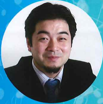
バリトン 奥村 泰憲